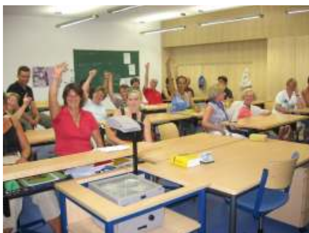
Weitere Bilder unter www.sfv-kirchheim.de/uns/rueck2006.htm