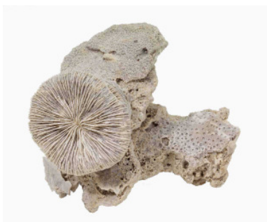
Fossile Einzelkoralle Montlivaltia im Verband mit anderen Steinkorallen, Oberjura (150 Mio. Jahre), Nattheim, Schwäbische Alb. Kelchdurchmesser: 5 cm Material: Staatl. Museum f. Naturkunde Stuttgart

Der Alkoholgehalt dieser Getränke wird meist zwischen fünf und sechs Volumenprozent ausgewiesen. Damit enthält eine handelsübliche 275 ml-Alcopop-Flasche in der Regel etwas mehr Alkohol als zwei "Schnapsgläser" (à 20 ml) höher konzentrierter Alkoholgetränke (Spirituosen).